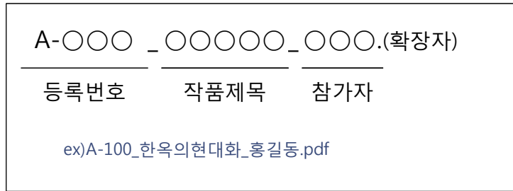
[그림 1] 작품패널 파일명 예시

※ 패널에는 참가자의 이름, 소속 등 특정 개인을 식별할 수 있는 정보 기재 불가