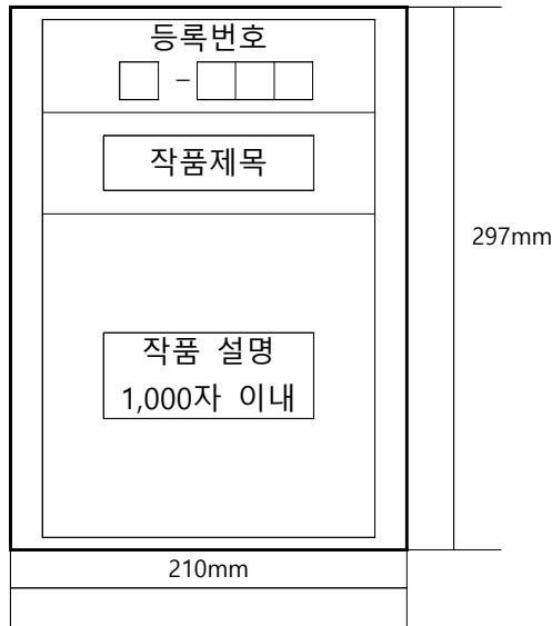
[그림 3] 작품설명서 양식